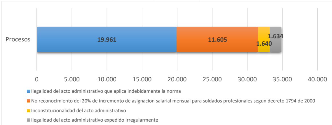
Gráfica 2. Principales causas procesales

De igual modo, se identificaron 39 causas procesales para este tipo de demandas, pero 4 de estas concentran el 80% de los procesos.