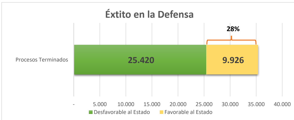
Gráfica 3. Tasa de fallos desfavorable a los intereses del Estado

El sistema Ekogui reporta que, del universo de los 37.057 procesos terminados, 35.346 registran sentido del fallo; de estos últimos, 25.420 procesos tuvieron fallo desfavorable, es decir, finalizaron en contra de los intereses del Estado. Lo anterior implica que la tasa de éxito en la defensa jurídica por parte de las entidades se ubica en el 28%. Los 9.926 procesos restantes, terminaron con fallo favorable para el Estado 5 .